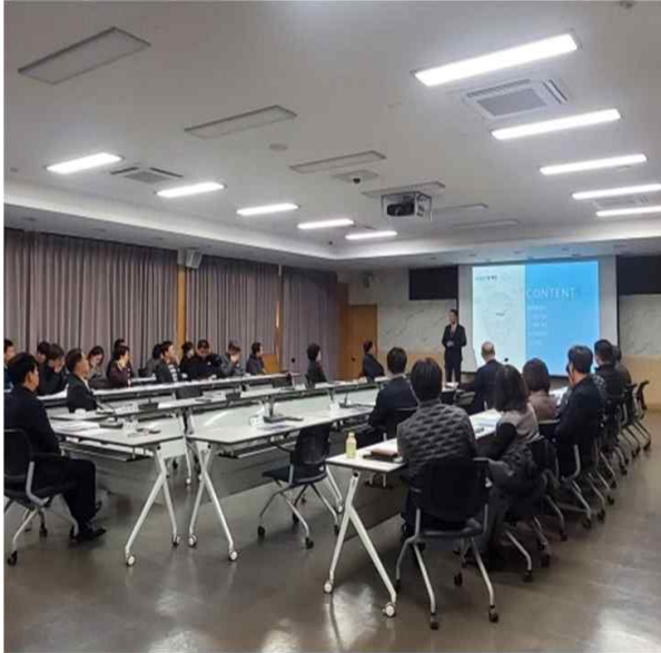
▲파주시 4일 민원콜센터 구축사업 완료보고회 개최.