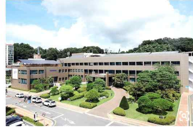
파주시청사 전경.

경기 파주시는 제9보병사단과 합의각서를 체결해 5.05㎢ 규모의 군사시설 보호구역에 대한 행정위탁을 확정했다고 2일 밝혔다.