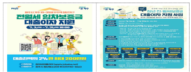
홍보물(청년 전세대출 이자 지원)