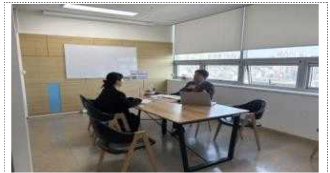
멘토링 활동 사진