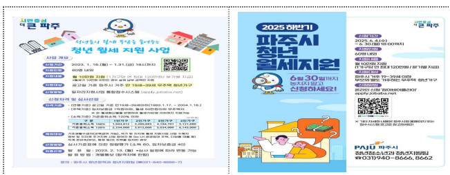
홍보물(청년 월세 지원)