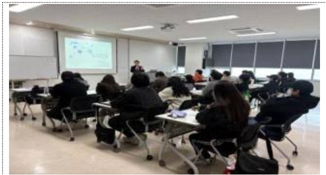
특강 운영 사진