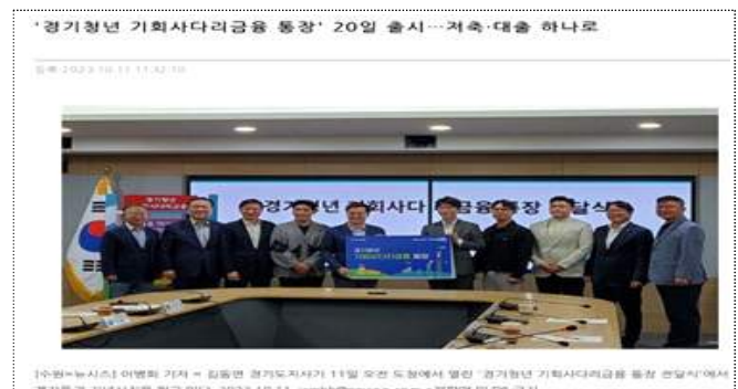
1차 공급계획 보도자료('23.10.11.)