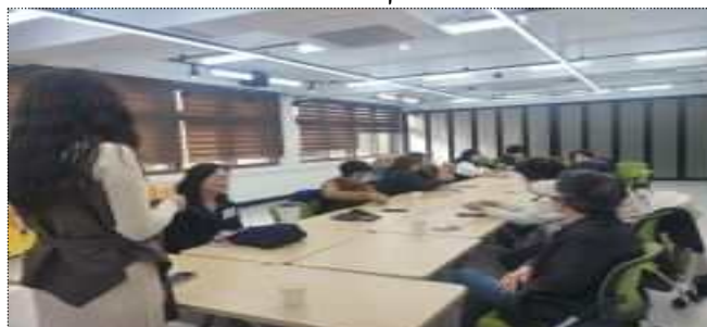
창작공간 활용 프로그램