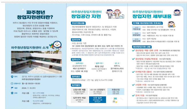
< 주청년창업지원센터 홍보물 >