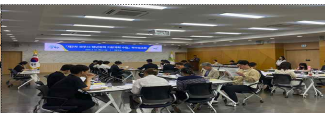
청년우익호 &amp; 청년정책협의체 여성회의