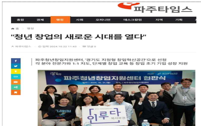
<경기도 지정형 창업혁신공간 현판식 보도자료>