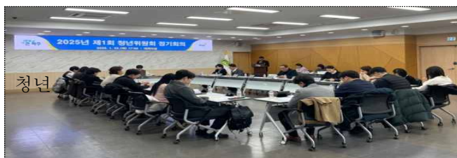
상반기 파주시 청년위원회