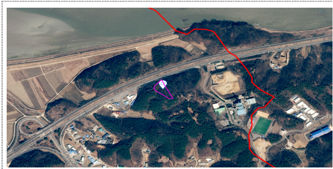
탄현 낙하리 산12-1 외 2