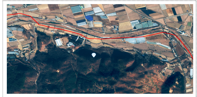
과평 덕천리 산12외 2