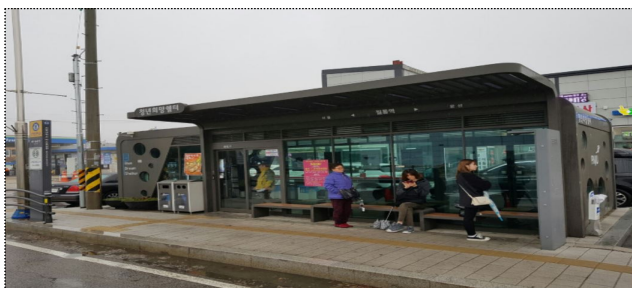
既 조성된 쉼터