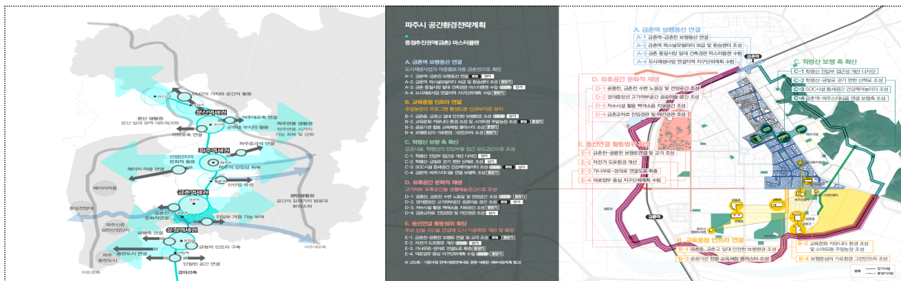
[중점추진권역 기본 구상]