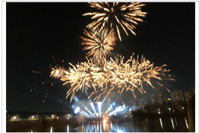
[2022년 제4회 운정호수공원 불꽃축제]