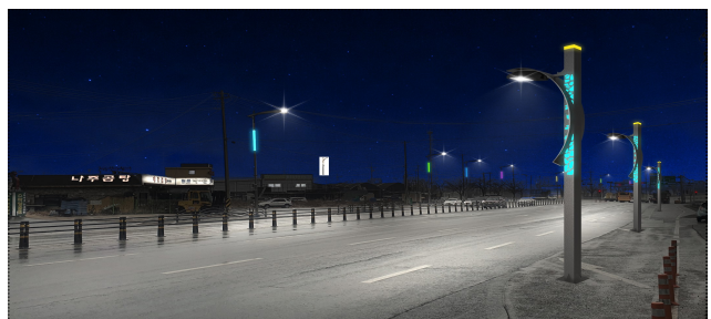
주변 경관 조명 예상도