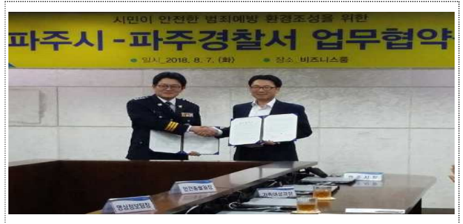
여성·아동 범죄예방 업무협약식