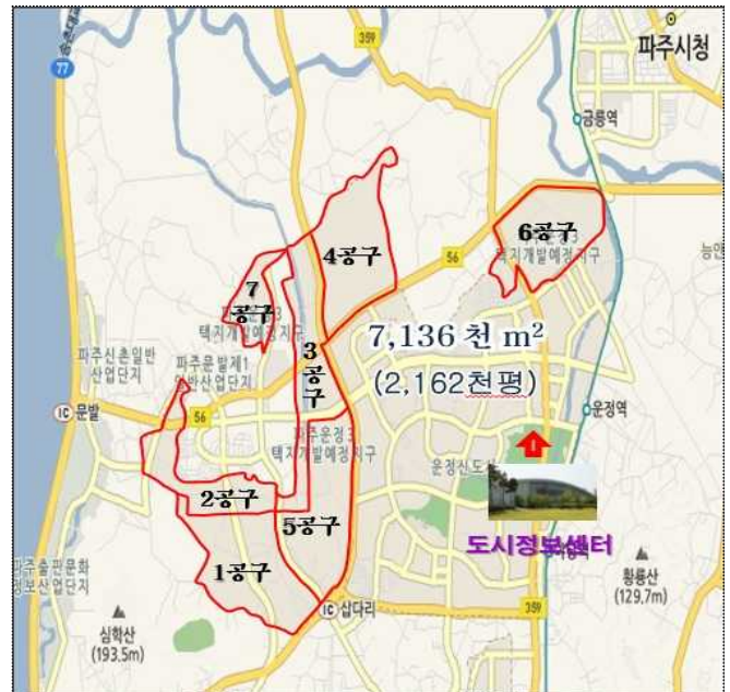
운정3지구 공구별 현황