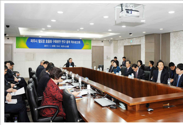
파주시 철도망 효율화 구축방안 연구 용역 착수 보고회